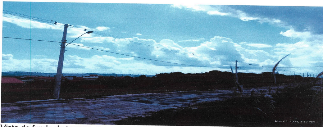
Vista do fundo do terreno, rua sem nome.

Prefeitura Municipal de Fartura, 07 de março de 2022.