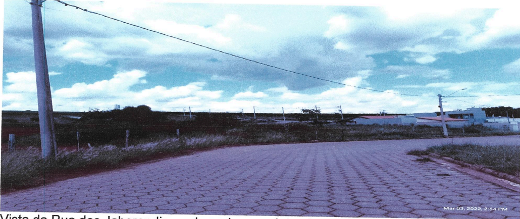
Vista da Rua dos Jaborandis, onde pode ver a lateral do terreno.