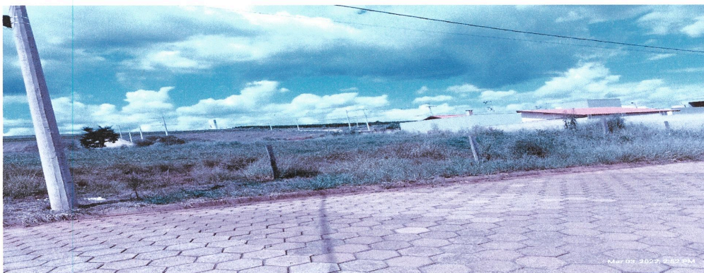
Vista da Rua dos Jaborandis, por onde se dará o acesso a entrada da Escola.