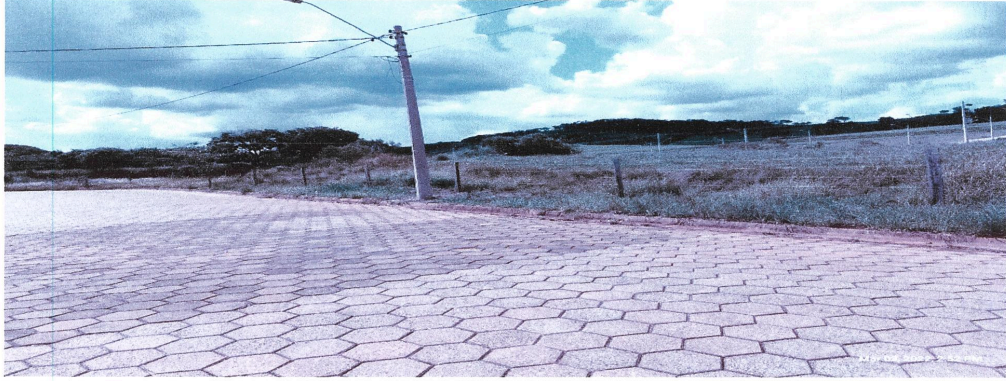
Vista da Rua dos Jaborandis, por onde se dará o acesso a entrada da Escola.