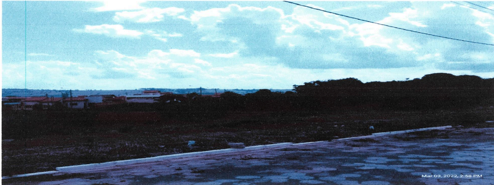
Vista do fundo do terreno, rua sem nome.