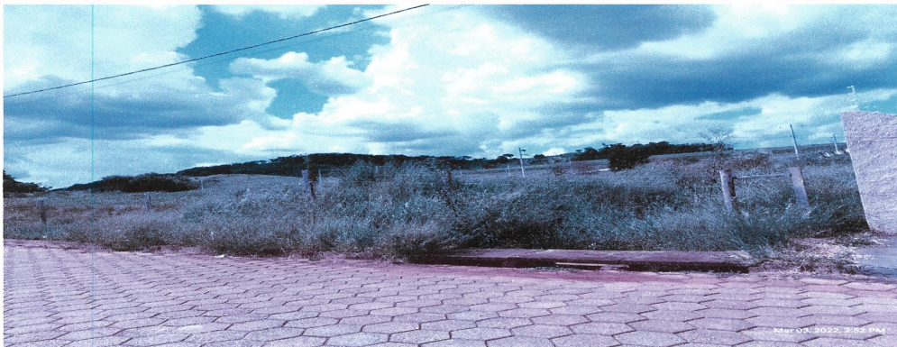
Vista da Rua dos Jaborandis, por onde se dará o acesso a entrada da Escola.