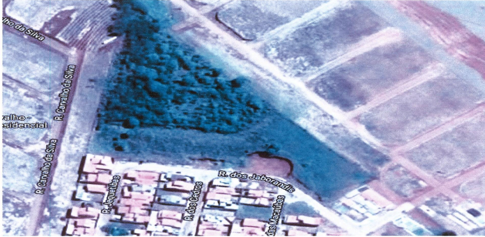
Localização do terreno