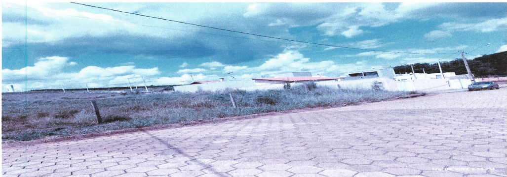
Vista da Rua dos Jaborandis, por onde se dará o acesso a entrada da Escola.