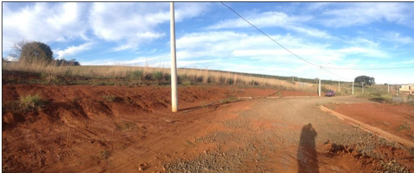
FOTO 2 – VISTA DA FRENTE DO TERRENO DO CRUZAMENTO DA RUA DOS JABORANDIS E RUA DOS MACAUBAS