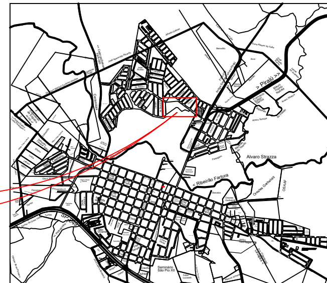
Planta de localização Sem esc.