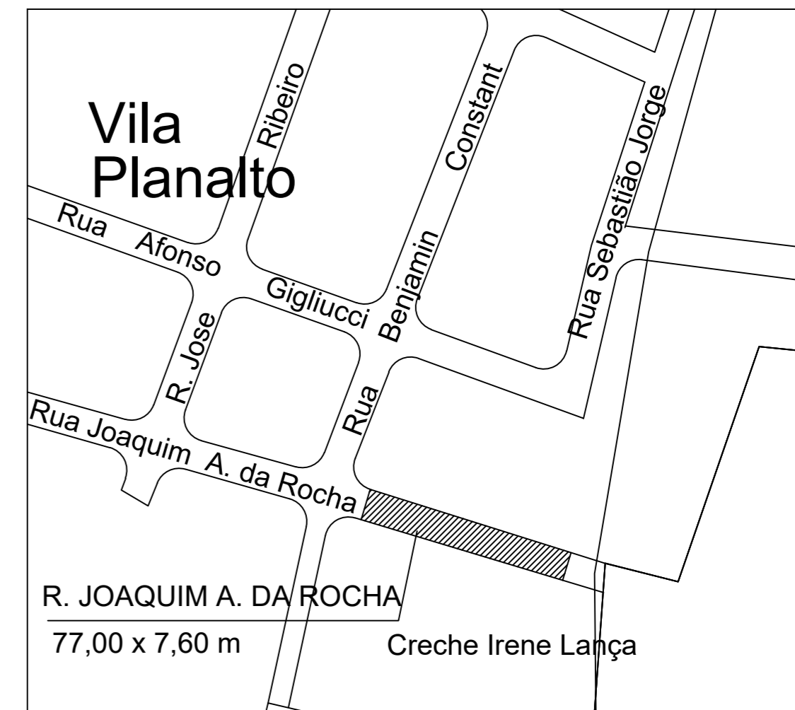
PLANTA RUA JOAQUIM ANTONIO DA ROCHA SEM ESC.